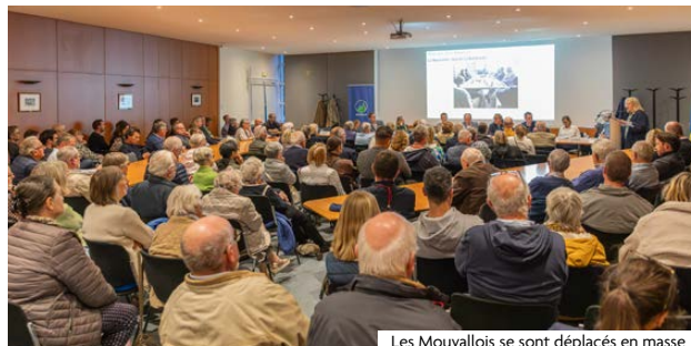
Les Mouvallois se sont déplacés en masse

Comme l'an passé, les réunions de quartier se sont tenues en présence de nombreux Mouvallois. Un dialogue direct entre élus et citoyens a eu lieu autour des projets et des enjeux de la vie quotidienne : circulation, stationnement, cadre de vie, projets d'aménagement ou encore animation locale. L'occasion pour chacun d'exprimer ses préoccupations, de poser ses questions et de partager des idées pour améliorer la qualité de vie. C'est Mouvaux vous propose quelques extraits de ces discussions.