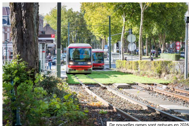
De nouvelles rames sont prévues en 2026