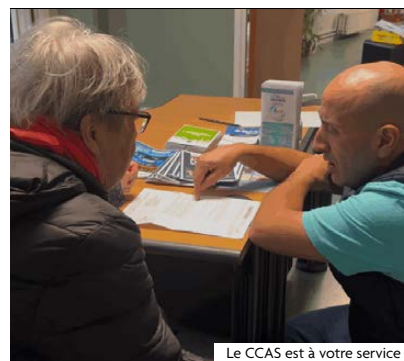
Le CCAS est à votre service

Tour d'horizon des principales missions du CCAS :