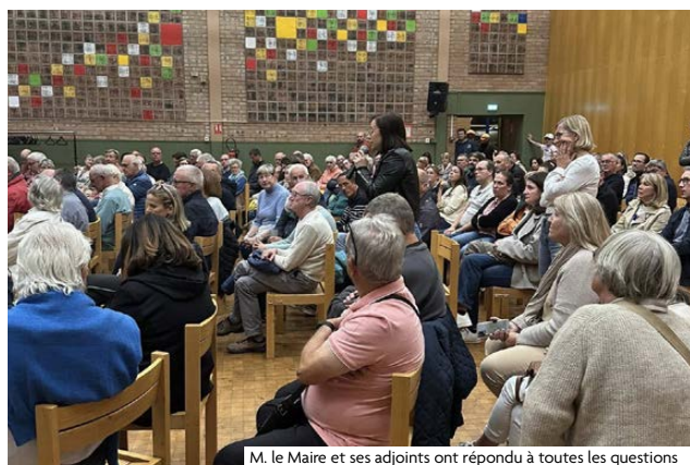
M. le Maire et ses adjoints ont répondu à toutes les questions

Le partage de la rue suppose aussi un changement d'habitudes. Le Code de la route impose désormais le double sens cyclable en zone 30, zone de rencontre et voies limitées à 30 km/h. Il peut aussi s'appliquer dans certaines rues à 50 km/h, avec accord de la MEL.