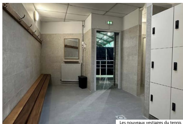
Les nouveaux vestiaires du tennis

Ce quartier riche en infrastructures sportives, a bénéficié de nombreux aménagements : fleurissement, potelets, mobilier urbain, inauguration de la promenade Masurel (parc du Hautmont), marquage des places du Vallon Vert et passage piétons rue de Lille. Côté sports, quatre poubelles ont été installées au city-stade, tandis que le complexe Nathalie Tauziat a vu ses courts régénérés et ses vestiaires refaits. La salle De Gaulle a également vu ses vestiaires rénovés, au bénéfice du club de basket ABC Mouvaux.