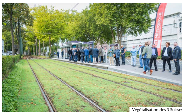
Végétalisation des 3 Suisses

L'été a permis d'adapter la signalisation aux terminus et d'expérimenter la végétalisation de quatre stations, dont celle des 3 Suisses. Complexe, cette opération a consisté à poser un tapis de sédum, plante résistante et peu exigeante en entretien, qui fera l'objet d'un suivi. Prochaines étapes : nouvelles rames en 2026 (elles offriront 30 % de places assises supplémentaires pourront accueillir jusqu'à 200 personnes avec un meilleur cadencement) et nouvelles lignes (projet Extramobile) d'ici 2035.