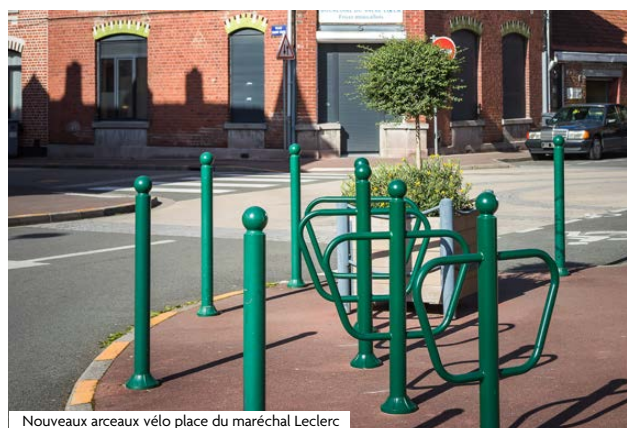
Nouveaux arceaux vélo place du maréchal Leclerc

Après le fleurissement rue Pierre Semard et la pose de potelets rue Vauban, les habitants voient avancer la requalification de la rue Jules Watteuw et des espaces alentours, lancée en février 2025. Après plusieurs tronçons déjà réalisés, le chantier se poursuit par le réaménagement complet des deux squares Mermoz et Delestraint et s'achèvera début 2026. Cette artère de 470 m se transforme pour sécuriser les déplacements, embellir le cadre de vie et mieux gérer les eaux pluviales. Place maintenant aux plantations : piétons et nature occuperont 46 % de l'espace public, dont 27 % d'espaces verts.