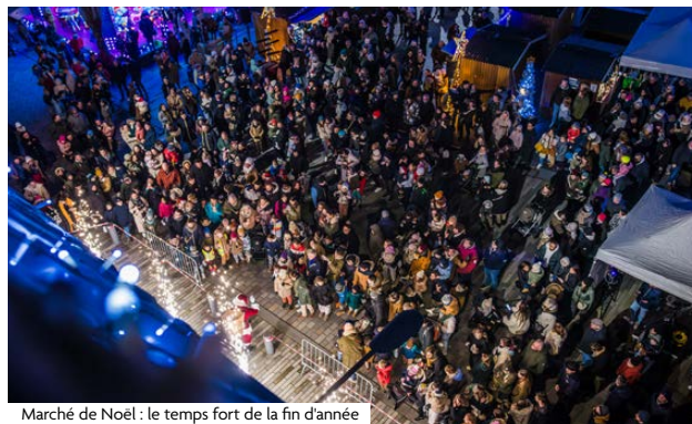
Marché de Noël : le temps fort de la fin d'année

Judi 27 novembre à 19 h L'étoile - Scène de Mouvaux