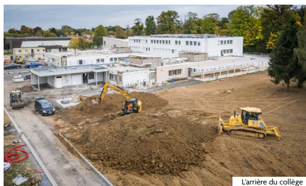
L'arrière du collège