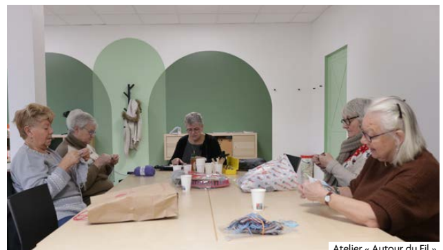
Atelier « Autour du Fil »