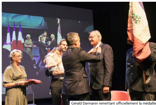
Gérald Darmanin remettant officiellement la médaille

Cette distinction vient reconnaître plus de 40 ans de carrière professionnelle et ses multiples engagements politiques au service de l'action publique.