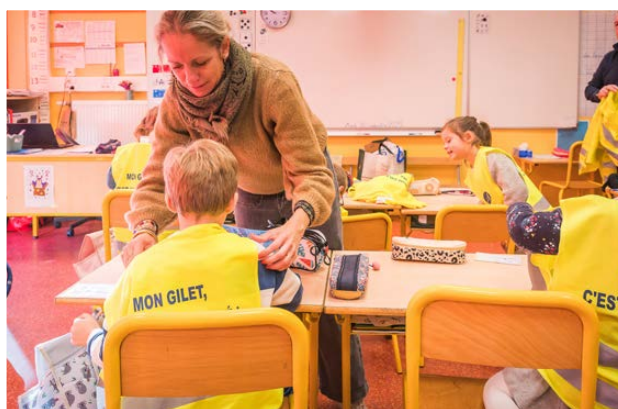
Remise des gilets jaunes