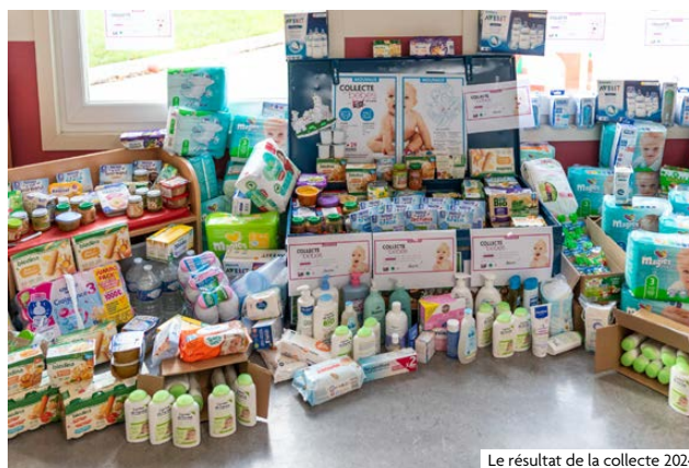
Le résultat de la collecte 2024