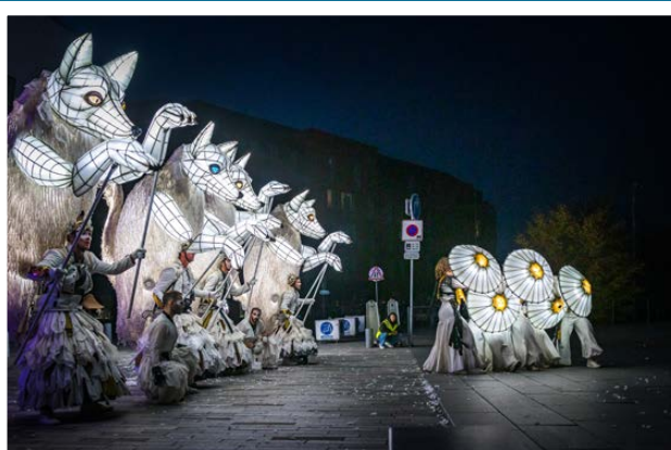
Fête des lumières