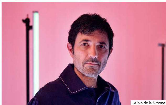
Albin de la Simone