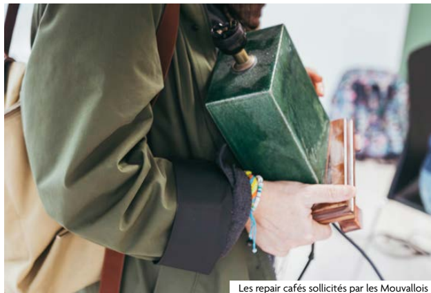
Les repair cafés sollicités par les Mouvallois

À Mouvaux, sept temps forts clôturent l'année 2025 pour sensibiliser petits et grands, à travers des ateliers gratuits, conviviaux et accessibles à toute la famille.