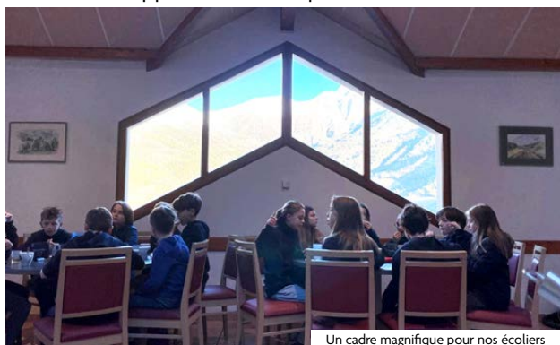
Un cadre magnifique pour nos écoliers

Au-delà de proposer des modes de garde, la Ville s'engage pour la réussite éducative de chaque enfant en offrant des temps d'accueil à vocation pédagogique. En partenariat avec l'Éducation Nationale, elle organise des classes transplantées pour les élèves de CM2 des écoles publiques et privées (Mouvaux est l'une des seules villes à proposer encore ces séjours). En 2026, 199 enfants partiront du 15 au 24 janvier à Lou Riouclar (Méolans-Revel, Alpes-de-Haute-Provence). Vivre ensemble 24h/24 permet d'intégrer les règles de vie collective et des valeurs essentielles comme le respect et le partage. Pour certains, c'est la première séparation avec le foyer, une étape clé vers l'autonomie. Ce séjour offre aussi un cadre propice à l'observation, l'expérimentation et la découverte, donnant du sens aux apprentissages. En combinant vie en communauté et pédagogie active, il constitue une expérience déterminante dans le développement de chaque enfant.