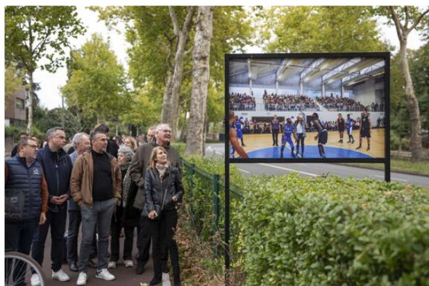
Exposition "Mouvoux, le sens de la fête"