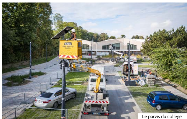
Le parvis du collège