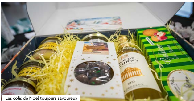
Les colis de Noël toujours savoureux