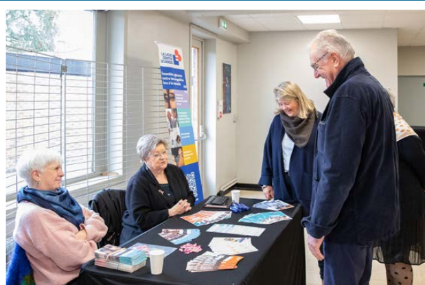
Samedis de la santé