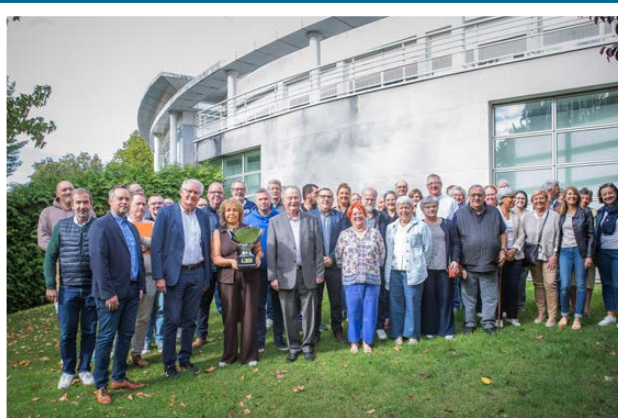
Cérémonie des partenariats Ville - Associations