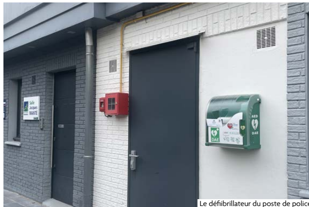
Le défibrillateur du poste de police

Retrouvez les emplacements et les sites équipés des DAE dans votre ville sur www.mouvaux.fr