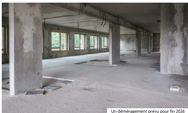
Un déménagement prévu pour fin 2026