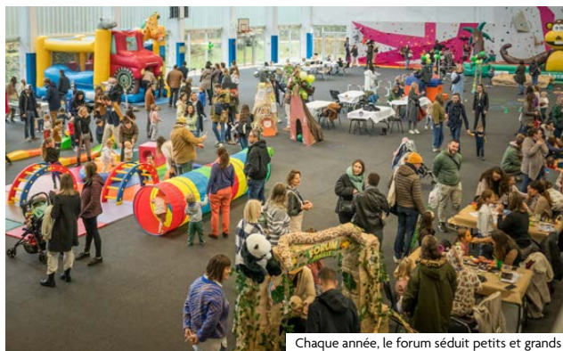
Chaque année, le forum séduit petits et grands

Une buvette et une tombola seront organisées au profit de l'UNICEF, avec la vente de boissons et de crêpes. Un foodtruck est également prévu. Une façon gourmande et solidaire de participer à la défense des droits de l'enfant.